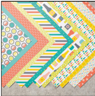
Designerpapier "Einfach spritzig" #147244