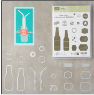
Produktpaket "Auf dich" #146084