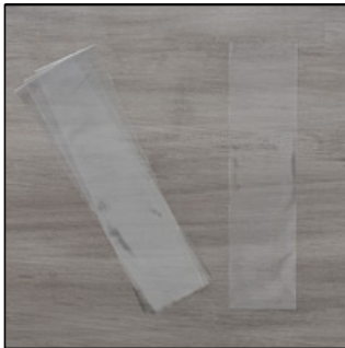
Zellophantüten in 5 #141703