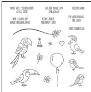
Stempelset Vogelgezwitscher #146889